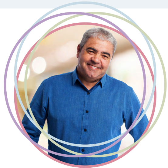
Foto de stock. Planteado por modelo.